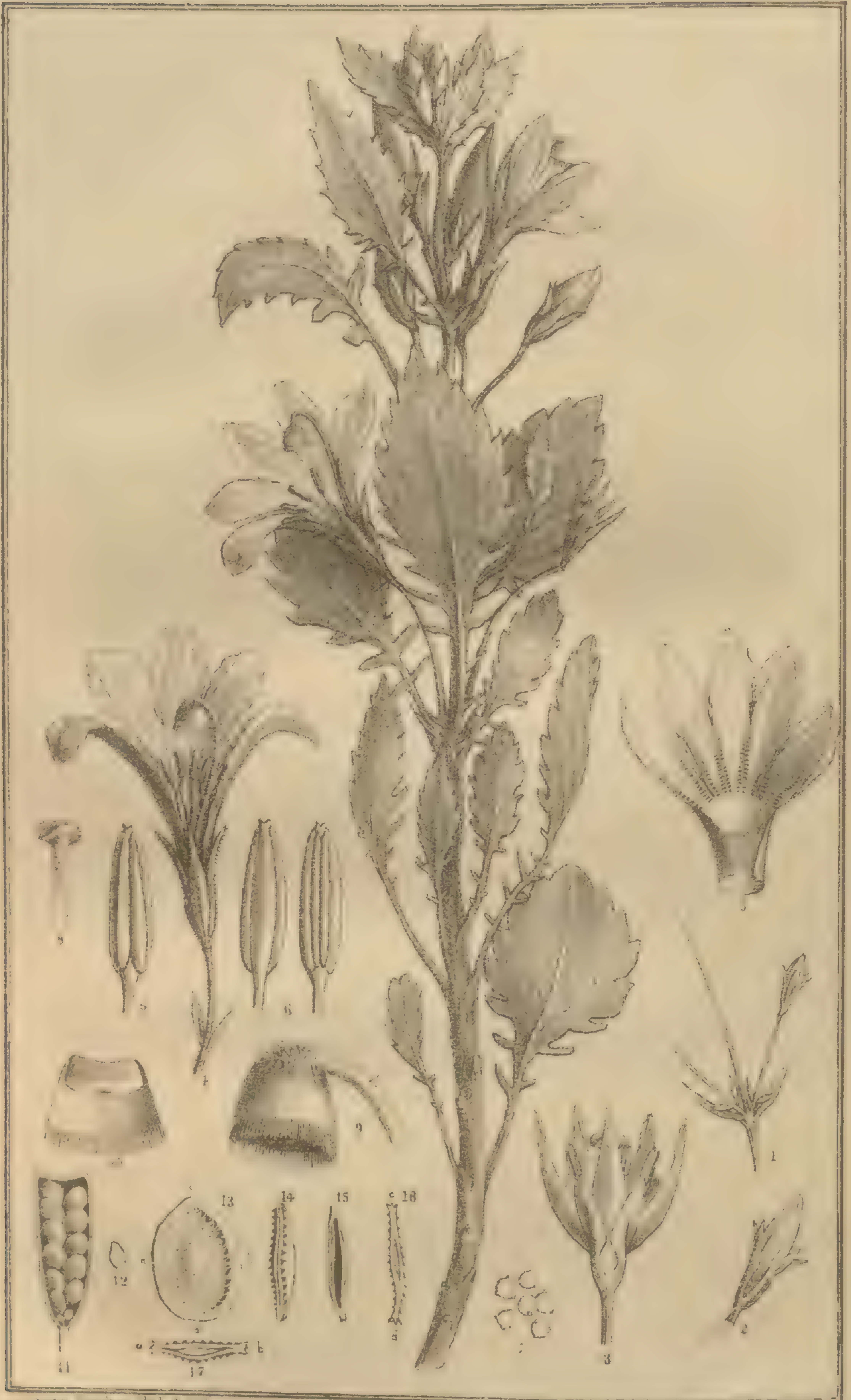
Goodenia Nicholsonii . M.M.